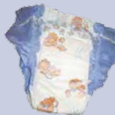
Pannolini e pannoloni