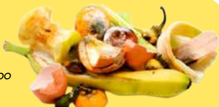
Avanzi di cibo