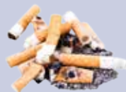
Cicche di sigarette