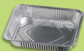
Vaschette in alluminio