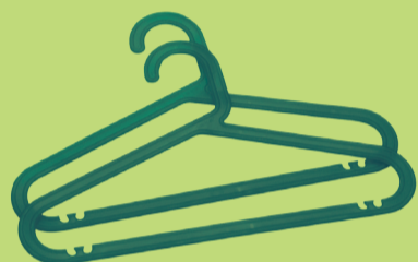
Gruce in plastica