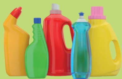
Flaconi per detersivi