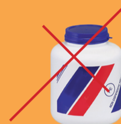
Contenitori per colla, solventi e vernici