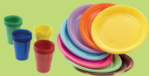
Piatti e bicchieri monouso